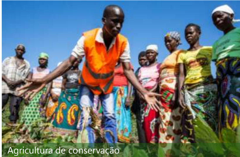
Agricultura de conservação

http://www.portucelmocambique.com/Media/Fotos-da-semana