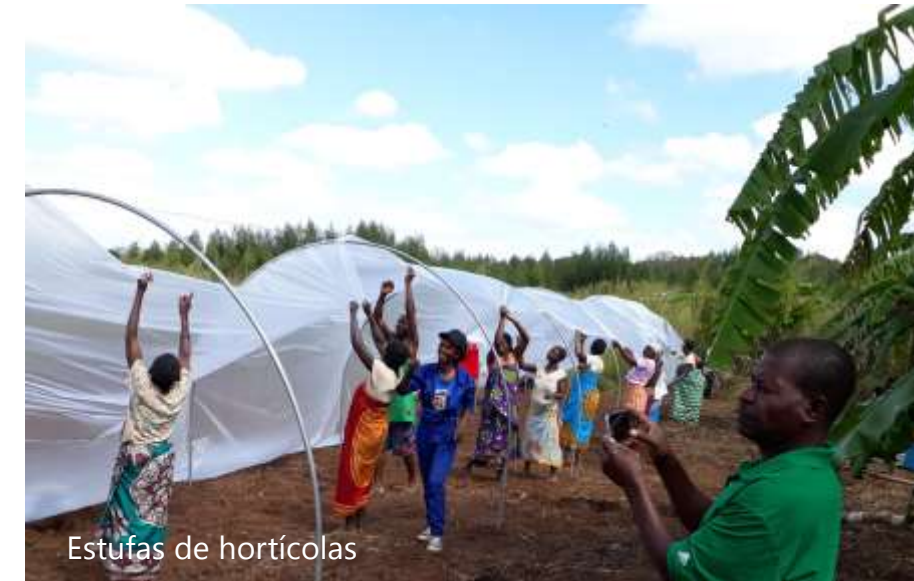
Estufas de hortícolas