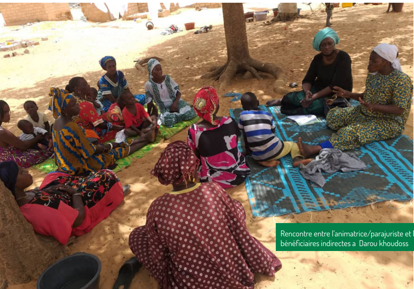
Rencontre entre l'animatrice/parajuriste et les bénéficiaires indirectes à Darou khoudoss

Les données collectées sont analysées, harmonisées et restructurées. L'interprétation des données mettra en évidence, les forces et faiblesses mais également les succès et échecs dans les interventions menées. L'approche utilisée par le projet, l'inclusion de multi-acteurs dans la démarche et les pratiques seront analysées.