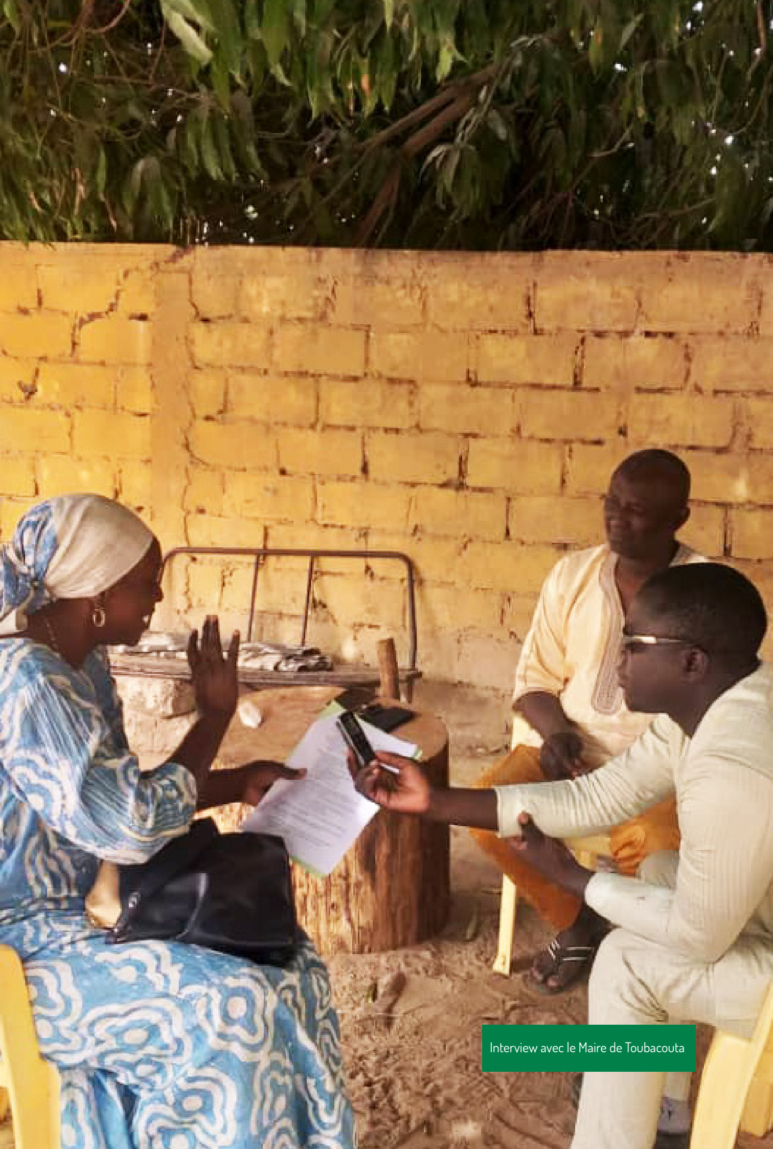
Interview avec le Maire de Toubacouta