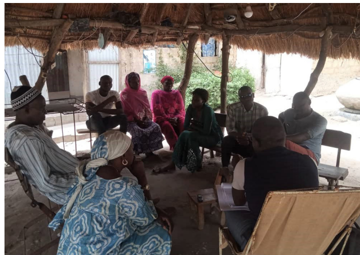
Rencontre avec le comité villageois à Toubacouta

Sur un autre plan, le processus de décentralisation n'a pas permis une gestion satisfaisante et l'application effective des principes et orientations de la loi sur le domaine national. Des obstacles humains, financiers, institutionnels et structurels altèrent les actions des instances exécutives et décisionnelles des collectivités locales en matière de gestion foncière. Une situation qui ne contribue pas forcément à sécuriser les droits coutumiers des communautés rurales, en particulier ceux des femmes, dans la mesure où l'État peut effectuer des transactions foncières à grande échelle sans informer ni impliquer les populations ni les services compétents locaux, au nom de l'utilité publique.