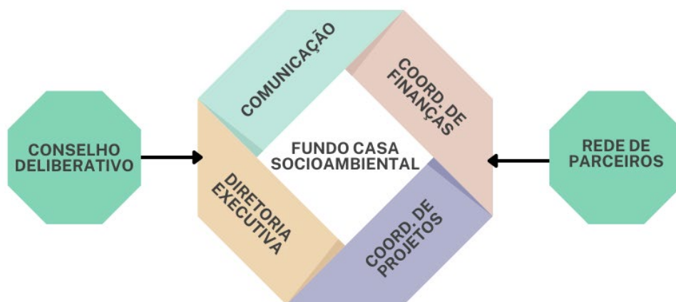
Imagem 1. Governança Fundo Casa

Grande parte das pequenas e médias organizações socioambientais dos países da América do Sul trabalha apenas com voluntários e com pouco ou nenhum recurso. Por estarem em territórios distantes, essas organizações encontram dificuldade em acessar recursos para seu funcionamento e para apoio às comunidades que representam. Neste sentido, a rede de parceiros do Fundo Casa tem o papel de apoiar no mapeamento de grupos que precisam de um primeiro apoio, conectando-os ao Fundo . O Fundo, por sua vez, apoia na construção de capacidades e fortalecimento institucional, promovendo a autonomia e a independência dos grupos, associações e comunidades locais. A Imagem 1 apresenta a estrutura da governança do Fundo Casa Socioambiental.