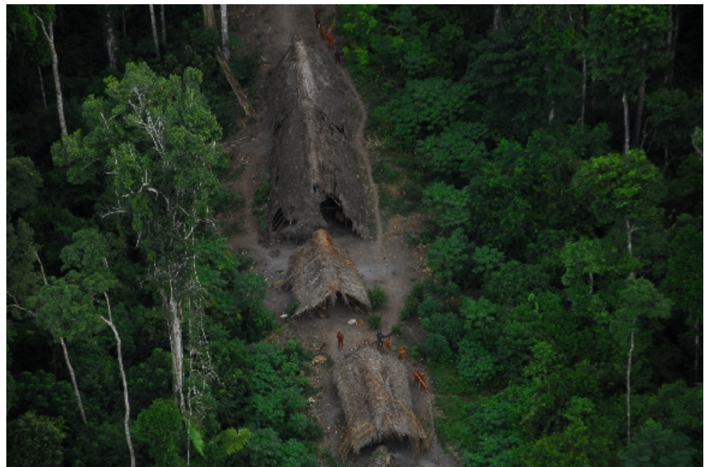
Povo em situação de isolamento voluntário no Rio Envira (AC).