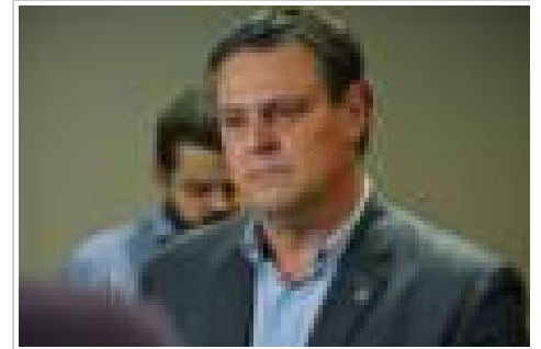
Vice-governador Carlos Fávaro: rodovia pronta, rodovia concessionada